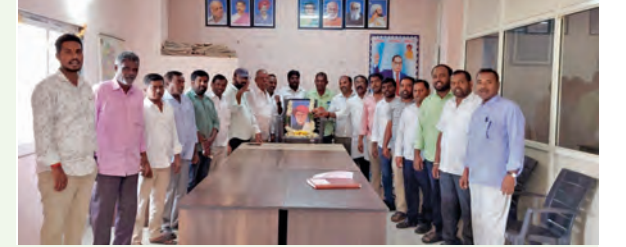
గణేశ్ టౌన్, ఏప్రిల్ 11 (ప్రభాతవార్త):