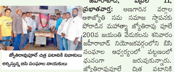
జ్యోతిరావుపూలే చిత్ర పటానికి నివాళులు అర్పిస్తున్న టీఎం సంఘాల నాయకులు