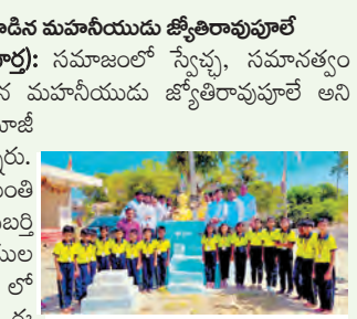
చెబిల్లో జ్యోతిరావుపూలే విగ్రహానికి నివాళులర్పిస్తున్న దృశ్యం