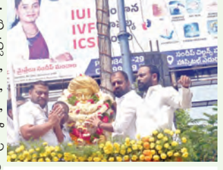
పూలే విగ్రహానికి నివాళులర్పిస్తున్న కాంగ్రెస్ నాయకులు అత్త తదితరులు