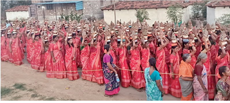
తులూ భవని మాతకు గంగాభిషేకం చేసేందుకు మంజీరా జిలాలను తీసుకుపోతున్న మహిళలు