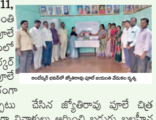
అంబేద్కర్ భవనంలో జయంతి వేడుకలను జరుపుకున్న దృశ్యం