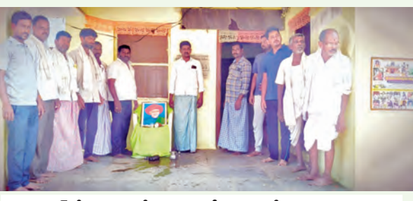
తమ్మారోడ్ మహాత్మా జ్యోతిరావుపూలే జయంతి వేడుకల దృశ్యం

తమ్మారోడ్, ఏప్రిల్ 11, ప్రభాతవార్త: మండల కేంద్రమైన తమ్మారోడ్ పాట మండలంలోని తమ్మారోడ్ గ్రామంలో శనివారం జ్యోతిరావు పూలే జయంతి వేడుకలను ఘనంగా జరుపుకున్నారు. ప్రత్యేకంగా ఏర్పాటు చేసిన