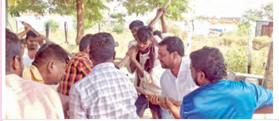
బోరు బావిని బాగు చేస్తున్న కొలూర్ గ్రామస్థులు