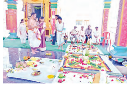
ప్రత్యేక పూజా కార్యక్రమంలో పాల్గొన్న భక్తులు