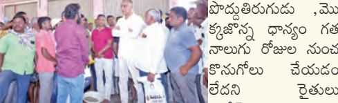
మాట్లి యార్డులో రైతులతో మాట్లాడుతున్న పాపివీరావు

సిద్దిపేట, ప్రభాతవార్త : ప్రతినిధి: రాష్ట్ర వ్యాప్తంగా ప్రభుత్వ నిర్ణయంతో రైతులు తీవ్ర ఇబ్బందులు పడుతున్నారు.. రైతుల పట్ల ప్రభుత్వం చిన్నచూపు చూస్తూ.. వంట కొనుగోలు చేయడం లేదని మాజీ మంత్రి, ఎమ్మెల్యే తన్నీరు హరివీరావు అన్నారు. జిల్లా కేంద్రంలోని వ్యవసాయ మార్కెట్ యార్డును ఆయన శనివారం సందర్శించి పొద్దుతిరుగుడు , మొక్కజొన్న ధాన్యం గత నాలుగు రోజుల నుంచీ కొనుగోలు చేయడం లేదని రైతులు పోరీషర్లు విన్నవించారు. ఆయన వెంట అధికారులతో ఘోసలో మాట్లాడి మార్కెట్ యార్డును సందర్శించి సమస్య పరిష్కరించాలని ఆదేశించారు. అనంతరం ఆయన మాట్లాడుతూ నారాయణపేట్, ఆదిలాబాద్, నిజామాబాద్ కేంద్రాల్లో జొన్న కొనుగోలు సెంటర్లను ప్రారంభం చేయలేదని వెంటనే కొనుగోలు కేంద్రాలు ప్రారంభించి మద్దతు ధర అందించాలన్నారు.